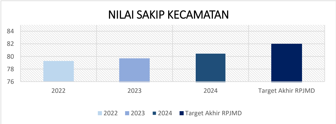
Grafik 3.12 Nilai SAKIP KECAMATAN

Sedangkan jika dibandingkan dengan Nilai SAKIP tertinggi di Kabupaten Boyolali lebih rendah yaitu sebesar 7,2 nilai dalam hal ini realisasi Tertinggi di Kabupaten Boyolali sebesar 87,7 Perkembangan Nilai Sakip Kecamatan Andong dari tahun ke tahun mengalami kenaikan Sebagaimana dapat dilihat pada grafik berikut: