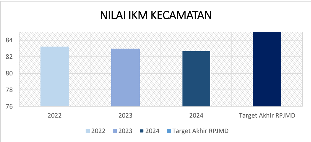
Grafik 3.6 Indeks Kepuasan Masyarakat

Unsur-unsur yang berperan dalam pencapaian Target Meningkatnya Kepuasan Masyarakat dalam Pelayanan Publik adalah sebagai berikut: